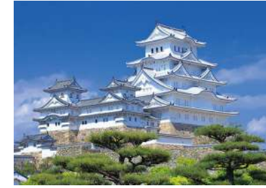
Château de Himeji