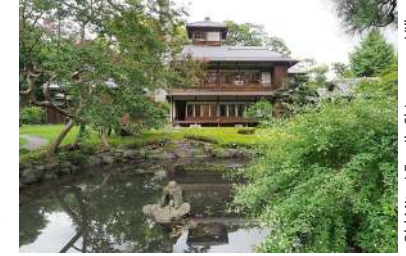
Old Mitsui Family Shimogamo Villa