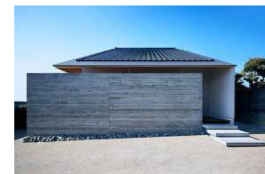
Maison de tuile