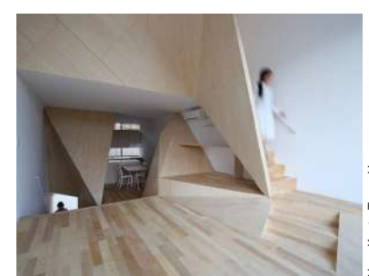
New Kyoto Town House