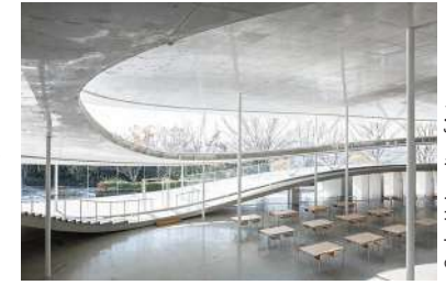
Osaka University of Arts,