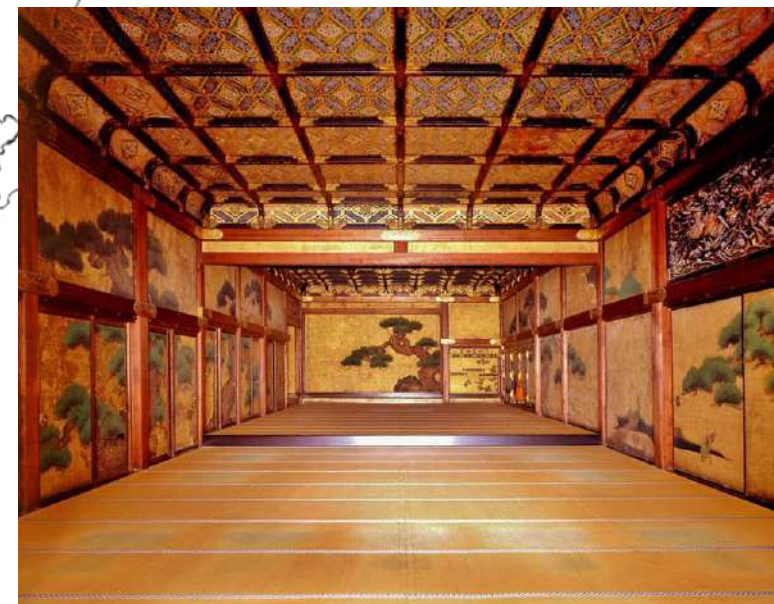
Chateau de Nijo