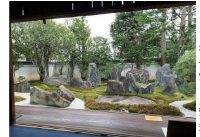
Mirei Shigemori Garden Museum