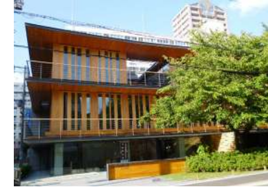
Syndic grossiste du bois d'Osaka