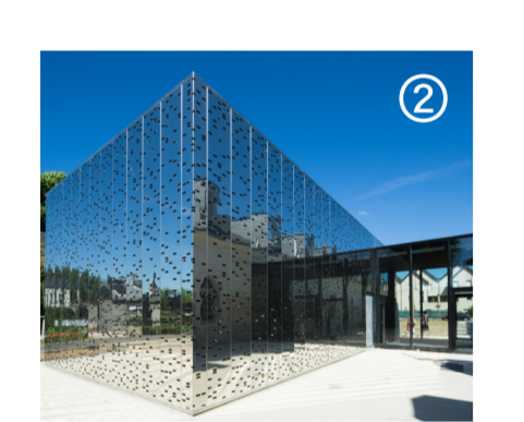
Ciclic-Vendôme @pashrash Architectes Chevalier + Guillemot