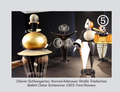
Oberer Schloßgarten, Konrad-Adenauer-Strasse Triadisches Ballett Oskar Schlemmer 1922, Fred Romero

Ordre des architectes, 44/46 quai Saint-Laurent Orléans (45000) Tarif: Entrée libre / sous reservation Infos: 02 38 54 08 96 www.ma-cvl.org / info@ma-cvl.org