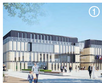
© W&A - Wilnotte & Associés architectes

Antre Peaux, 24/26 route de la Chapelle, Bourges / Tarif: gratuit / Sur inscription: transpalette@antrepeaux.net