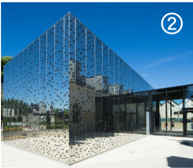
Ciclic-Vendome @ipashrah Architectes Chevalier + Guillemot

Tarif: Gratuit, places limitées, merci de vous inscrire avant le 17 oct. à assistante-communication@territoiresvendomois.fr