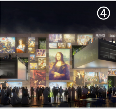
ClémentBlanchet - FrenchDubaiPavillon - Louvre

La Chancellerie, 8 rue du Château, Loches (37600) Tarif: Entrée libre tous les jours de 10.00 à 18.00 Infos: T. 02 47 59 48 21 www.ville-loches.fr / ChapedesElle