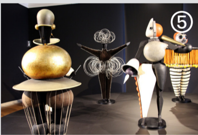
Oberer Schlossgarten, Konrad-Adenauer-Straße Triadisches Ballett Oskar Schlemmer 1922, Fred Romero

Ordre des architectes, 44/46 quai Saint-Laurent Orléans (45000) Tarif: Entrée libre / sous reservation Infos: 02 38 54 08 96 www.ma-cvl.org / info@ma-cvl.org