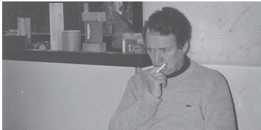
Conception EBM Archives Cd 18 - Imprimerie Cd 18 - Août 2024